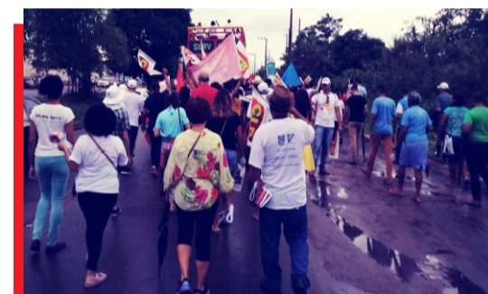
1º de Maio Unificado na Romaria do Trabalhador, na Área Itaqui Bacanga. A romaria saiu do Anjo da Guarda para Vila Embratel, onde encerrou com a celebração de uma missa.