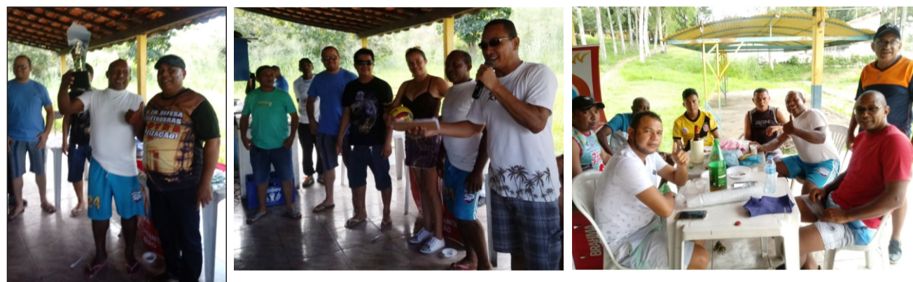
Festa do Trabalhador na Regional de Pedreiras com torneio e muita animação