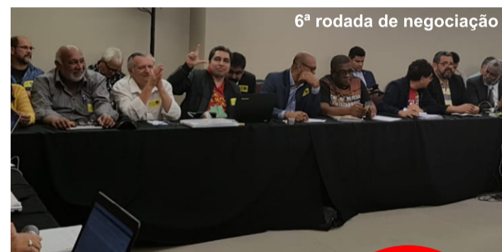
6ª rodada de negociação

Campanha Nacional dos Trabalhadores e Trabalhadoras da Eletronorte pela demissão do pior presidente da empresa. Vista essa camisa em defesa do setor elétrico e dos seus trabalhadores!