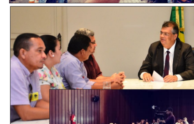
Debate na Assembleia Legislativa e Audiência com o Governador Flávio Dino