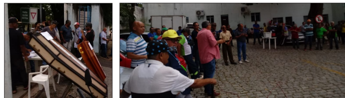
Enterro simbólico da gestão na mobilização de maio e assembleia final da campanha salarial em junho

Antes, a luta garantiu regularização de direitos conquistados