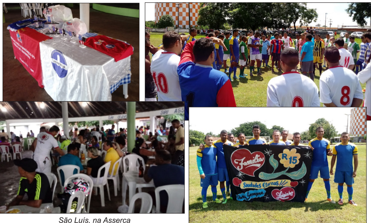
São Luís, na Asserca

Viva a luta dos trabalhadores. Viva a confraternização dos que lutam!