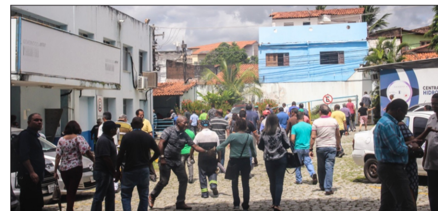
Dispersão da Assembleia de 21 de junho, na sede da Caema. Fim da Campanha Salarial. Mais uma batalha vencida.

Na assembleia do dia 21 de junho, a Caema melhorou a proposta para 90% e os trabalhadores aprovaram o aditivo, considerando que houve avanço. Em 2017, a empresa pagou o tiquete natalino no valor de 80% do mensal. Mas a luta pelos 100% permanece.