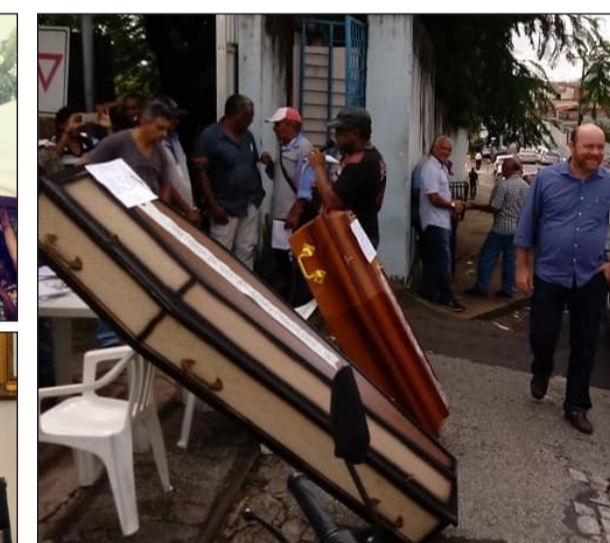
Acima, mobilização na porta da empresa com enterro simbólico da gestão