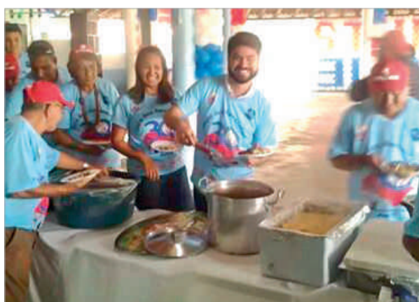
Uma festa descontraída que animou aos participantes