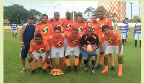
Foto do time campeão