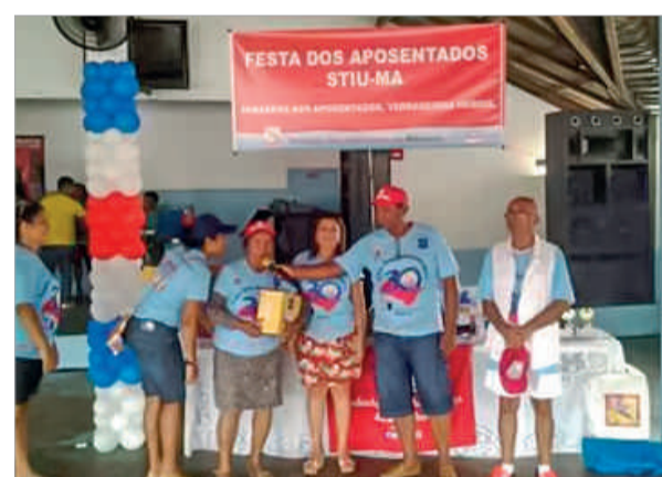
Sorteio e entrega dos prêmios