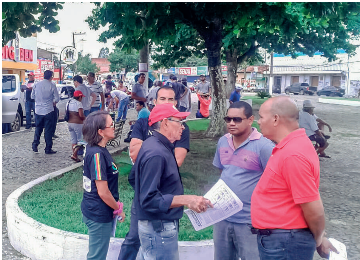
Diretores do STIU-MA durante Ato Público em Santa Inês

Inadmissível é a situação pela qual os moradores de Santa Inês estão passando. Lá, o prefeito resolveu atender aos interesses da Empresa Brasil Central de Engenharia (EMBRACE) e deixar as necessidades da população de lado, PRIVATIZANDO o fornecimento de água no município.