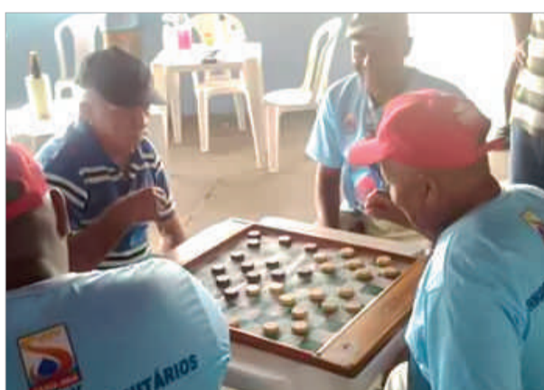
Torneio de Dama