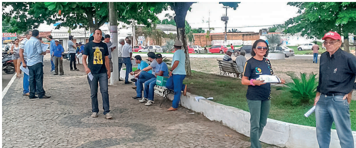
Distribuição de panfletos na Praça da Matriz

Mais uma vez, o STIU-MA teve sucesso no que se propôs e se engaja nesta luta que é coletiva.