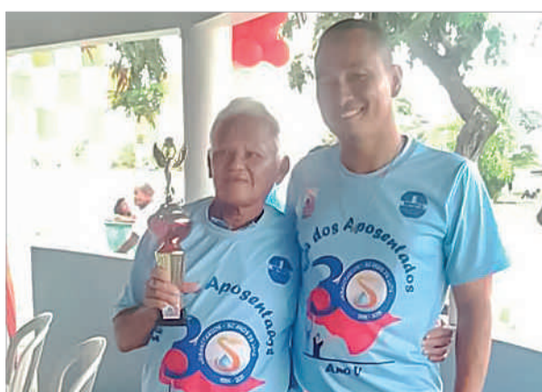
Premiação entregue aos participantes