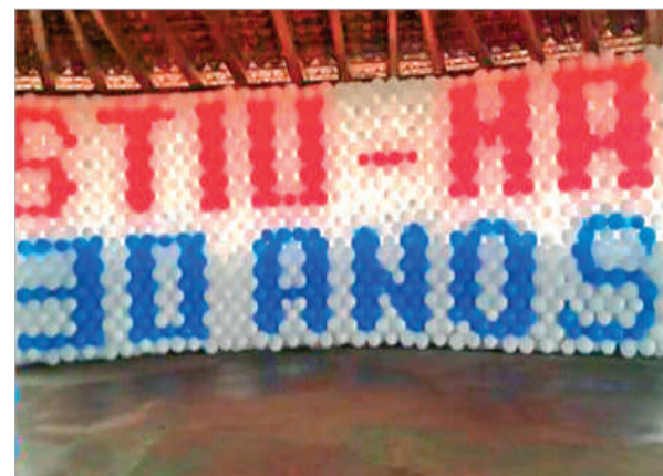
Decoração lembrou os 30 anos de luta do STIU-MA