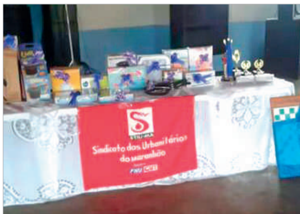
Prêmios sorteados durante a festa