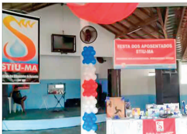
As boas vindas aos aposentados