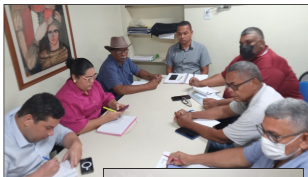
Reunião de Negociação do dia 17/06