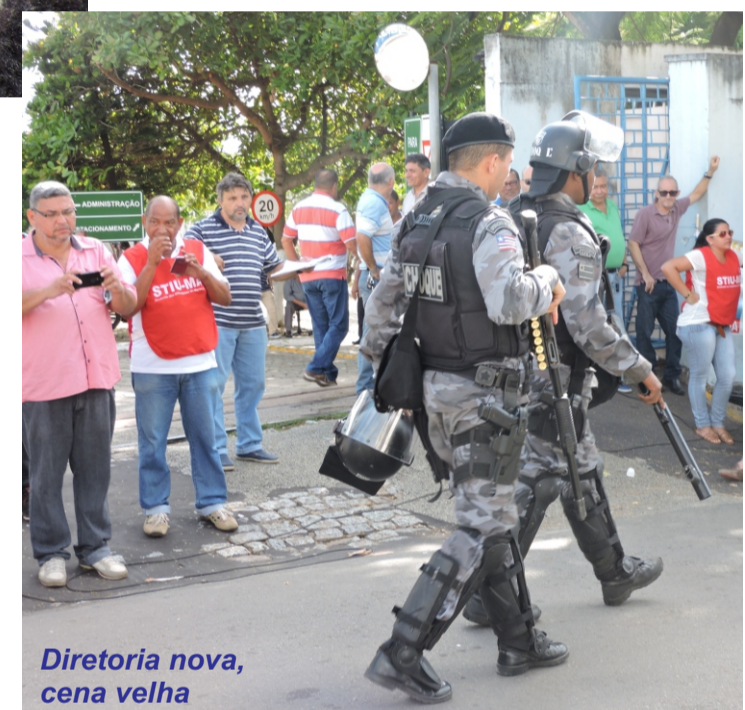
Diretoria nova, cena velha