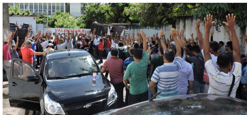
Acima, a paralisação de 48 horas realizada em maio, em São Luís. Nas demais fotos, momentos da mobilização nos sistemas de Chapadinha, São Domingos, Santa Luzia do Tide, Santa Inês e Imperatriz.

Após várias investidas do Sindicato, inclusive buscando diálogo com órgãos do executivo, com o parlamento e com a própria diretoria da CAEMA, a negociação foi retomada. Foi a chance que o Sindicato teve para discutir, além das cláusulas do ACT descumpridas, soluções para os Contratos de Concessão e Faturamento Suspense.