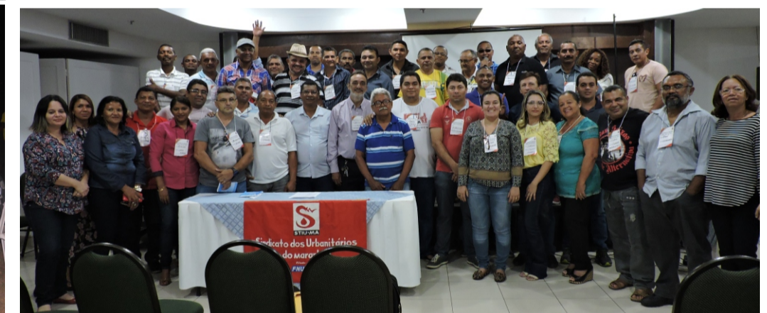
Membros da diretoria eleita, reunidos no Holiday Inn Hotel, em São Luís, no dia 15 de julho.